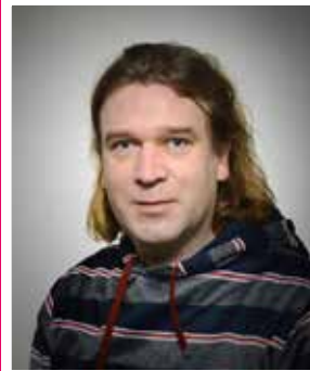
104 Turikka Kaukametsä

Argeologian maisteriopiskelija Puistopuutarhuri, Huk Toijala