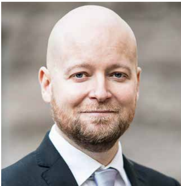
Opetusministeri Jussi Saramo

Mitä tämä sitten tarkoittaa käytännössä? Tulevina vuosina koulutukseen ja terveydenhuoltoon tullaan tarvitsemaan lisää varoja.